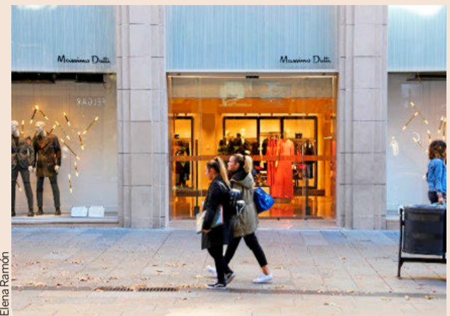
La nueva tienda está a escasos metros de su anterior ubicación.